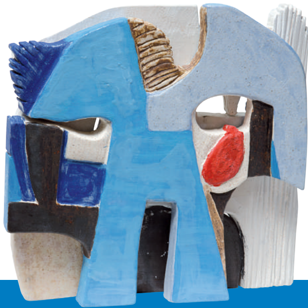
Narciso Besciani - Omeoart - Collettiva "Salute Felicità" "Genetical memories" - 2013